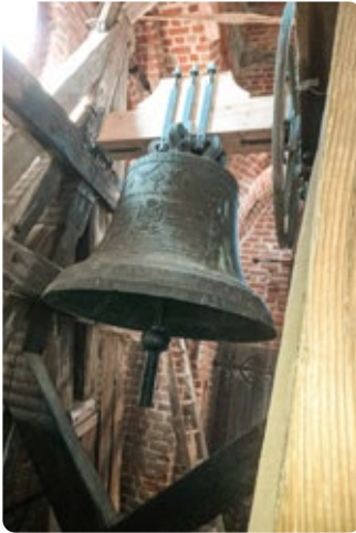
Das neue Glockenjoch