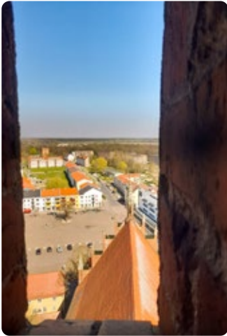
Blick über Friedland