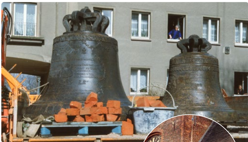
Abnahme zur Reparatur 1994