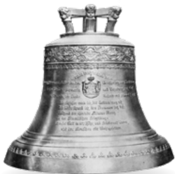
Die nicht mehr vorhandene größte Glocke

1994 wurden die beiden Glocken von 1710 und 1820, die extrem ausgeschlagen waren, durch Runderneuern restauriert und an neuen Holzjochen aufgehängt.